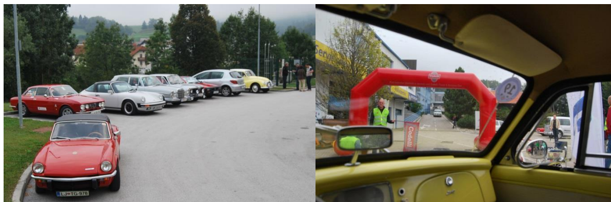
Na časovni kontroli prologa

sledilo tudi razpoloženje. Vendar za naslajanje ni bilo časa, saj je že ob 10:01 prva posadka morala na glavno etapo in ostale za njo v minutnih presledkih.