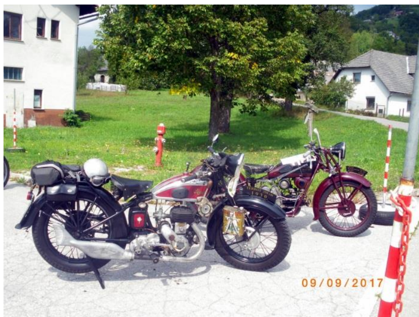
Motorji počivajo, motoristi pa na golažu.